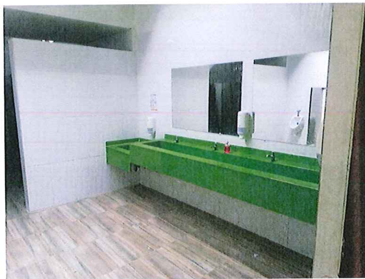
Cielos Rasos en PVC salones de secundaria