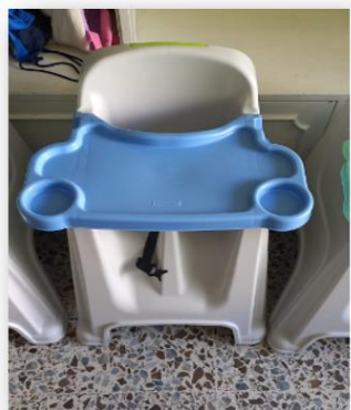
COMEDOR PARA BEBÉ RIMAX 6UNDS