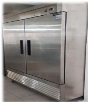
CONGELADOR VERTICAL DOS PUERTAS