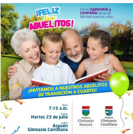
Copa Aspaen Bucaramanga