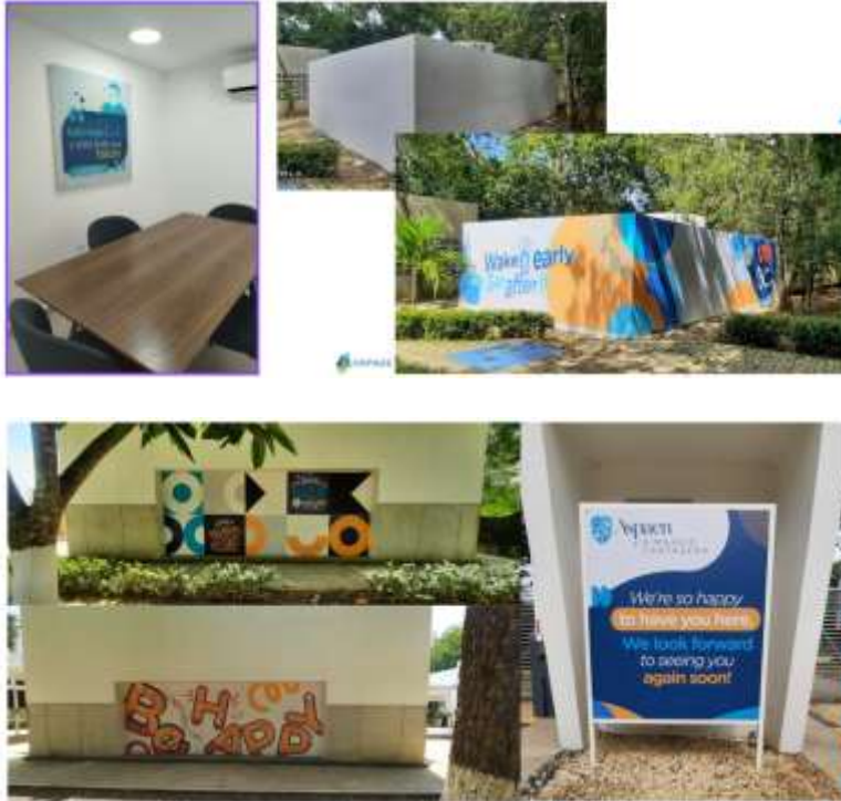
Raspada y pintura de paredes en salones de bachillerato para cambio de diseño -Se cambia pintura a mano por instalación de vinilos-