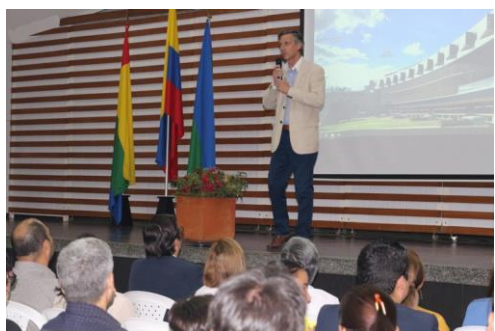
Charla “hábitos de alimentación saludable”