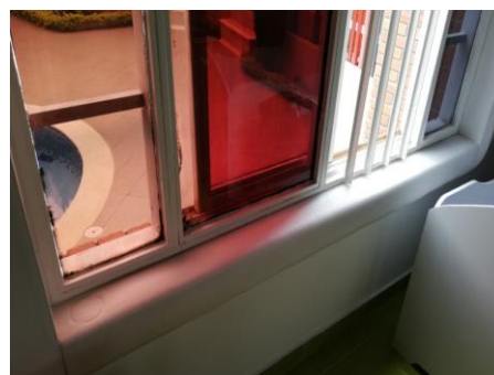
Arreglo puerta Baby Care