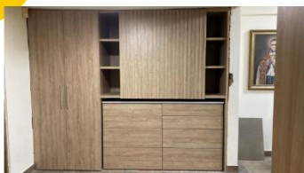
MUEBLE OFICINA SACERDOTE