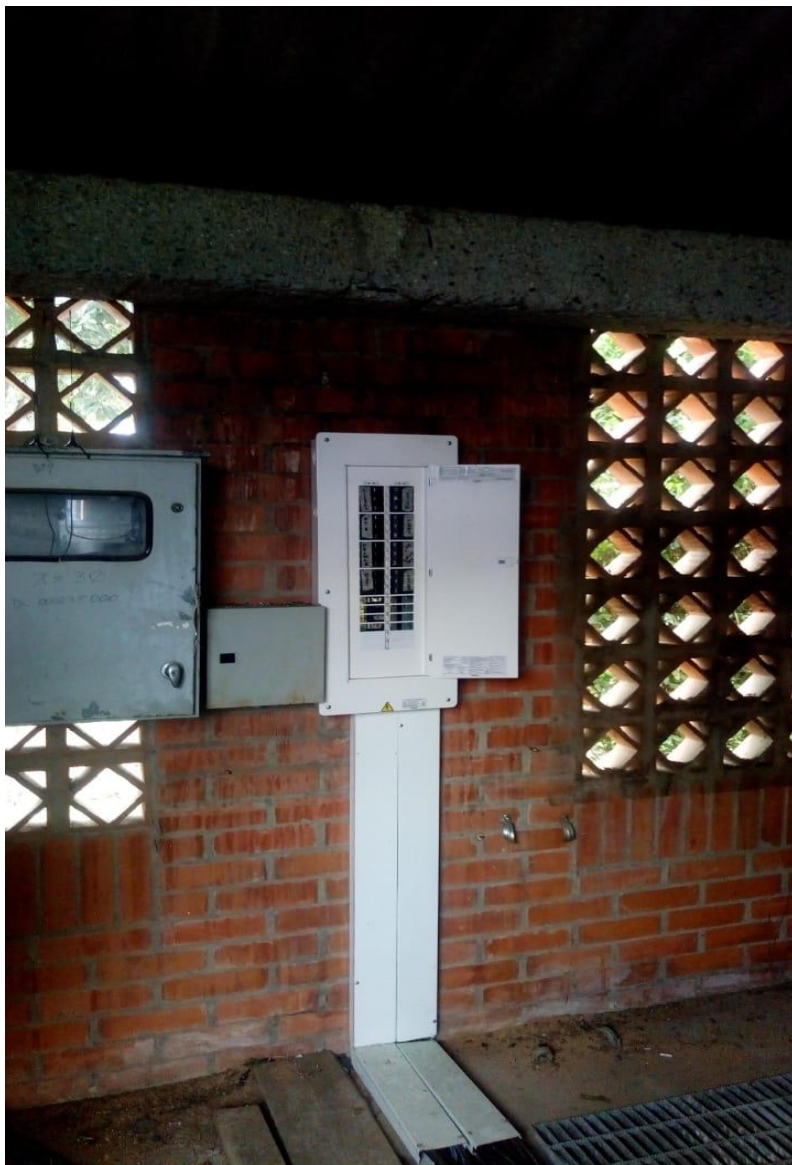
TABLERO DE PROTECCIONES PRINCIPALES Y TOTALIZADOR $ 5,140,800