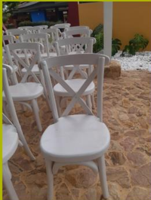
SILLAS ORATORIO ENTREVALLES

Durante el año 2023 la Corporación de Padres de familia para el desarrollo educativo Entrevalles se realizó compra de activos fijos por $ 8.584.259 así: