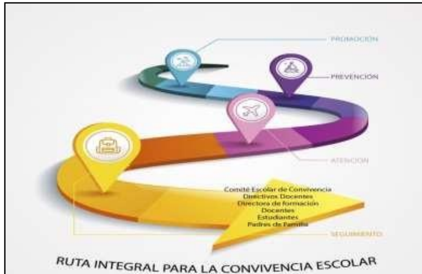
Ilustración 1, Funciones del comité de convivencia escolar